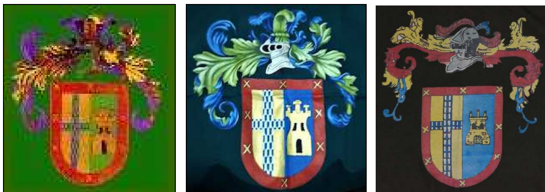
Imágenes N°1 (Anexo 15 b RG-2), N°2 (ejemplar en uso) y N°3 (ejemplar del Museo)