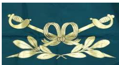
Modelos Nº2 (empleado en un ejemplar en uso) y Nº3 (ejemplar del Museo)

El principal error del diseño del ejemplar que se ilustra (Nº2) radica en que los gajos vegetales tienen hojas ovadas, nada que ver con las lobuladas, que son las propios del roble, lo que se debió respetar atento lo dispuesto por el artículo 6.008 del Reglamento