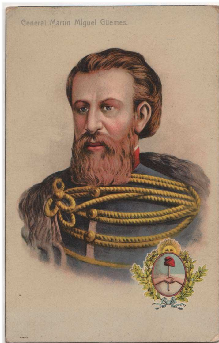
Antigua ilustración del Grl. Martín Miguel de Güemes