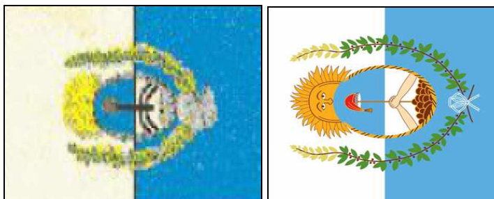
Imágenes 1 (dibujo en el RG-2) y 2 (dibujo de Francisco Gregoric)

(2) La representación de esta banderola que está contenida en el Reglamento de Ceremonial interno de GNA en su anexo IV es la siguiente (imagen 1). Como vemos también aquí luce por la pobreza de su diseño, totalmente pixelado debido al pequeño formato usado para su representación.