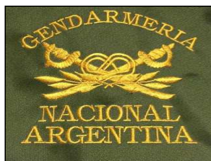
Emblema de Gendarmería Nacional, imagen no reglada

Las referencias sobre su creación y diseño constan en el “ Reglamento de Ceremonial de Gendarmería Nacional ” (RG-2) 2006, que fue aprobado por la Disposición DNG