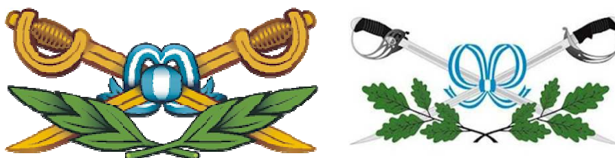
Modelos 1 y 2

La figura es muy pobre , por calificarla con benignidad y, además, se contradice con la norma vigente como se lo comentaré más abajo. Lo expuesto generó distintas versiones , de las que seguidamente aportó dos ejemplos: