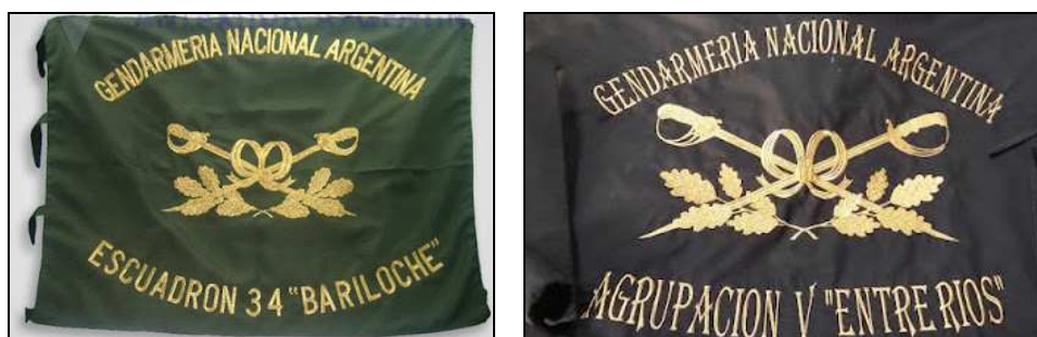
Estandartes del Escuadrón 34 “Bariloche” y de la Agrupación V “Entre Ríos”

En este punto partimos de lo fáctico mostrando como ejemplo un par de estandartes de Gendarmería que identifican a dos elementos orgánicos. Se verá que tienen elementos similares, pero que no son idénticos, una diversidad que se explica en la falta de precisión de la norma que define a estos símbolos.