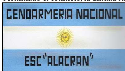
Reconstrucción de la bandera utilizada en la campaña de Malvinas (Dibujo: Francisco Gregoric)